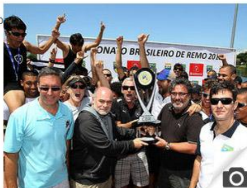
Botafogo conquistou o Campeonato Brasileiro de Remo

> Oswaldo recebe alta, mas só deve voltar a trabalhar na quinta