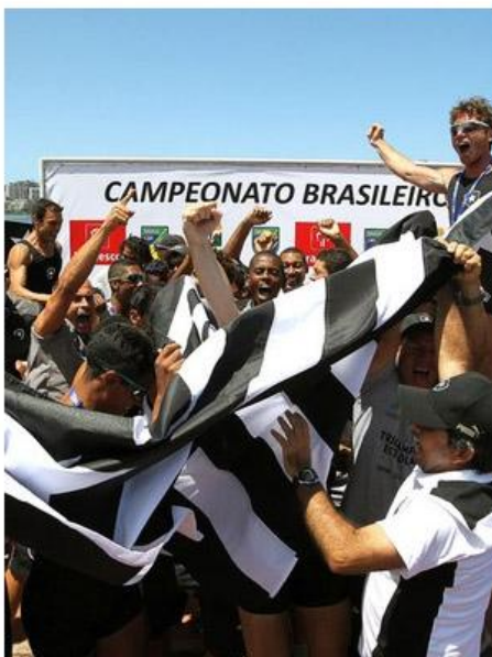
Remadores do Botafogo celebram conquista do Brasileiro

Depois três anos, o Botafogo conquistou o campeonato brasileiro de remo, disputado na Lagoa Rodrigo de Freitas, no último final de semana. Sem poder competir no ano passado em São Paulo por falta de verba, o Alvinegro confirmou o favoritismo e levou o caneco dessa temporada em cima do arquirrival Flamengo, segundo colocado. Daqui a duas semanas, o clube deverá levantar o troféu de campeão carioca e, novamente, sobre os rubro-negros, quebrando um jejum de 48 anos. O sucesso em 2013 se passa por dois fatores: a captação de novos talentos e a lei de incentivo fiscal.