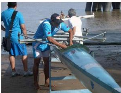
Equipe de remo do Paysandu conquistou duas medalhas