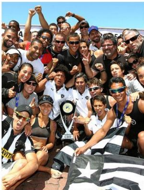
Equipe de remo do botafogo comemora título Brasileiro

Após conquistar quatro ouros, cinco pratas, um bronze e um quarto lugar no primeiro dia de finais do Campeonato Brasileiro de Remo, o Botafogo foi para a decisão da competição, neste domingo, com cinco pontos de vantagem sobre o segundo colocado, o Flamengo. Foi o suficiente para o Alvinegro conseguir manter a liderança, somar 141 pontos e conquistar o título da competição, realizada na Lagoa Rodrigo de Freitas, no Rio de Janeiro.